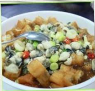
ถนนโบราณซือเฟิ่น