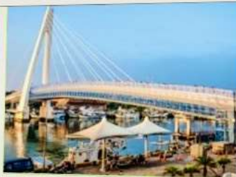
สะพานคู่รักตั้นส่วย