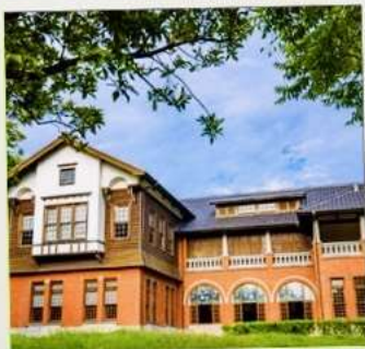
พิพิธภัณฑ์น้ำพุร้อนเป่ย์โถว