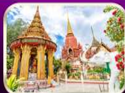
หอพระหลวงปู่ทวด วัดช้างให้