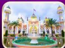
ชมมัสยิดกลางปัตตานี