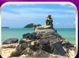
เที่ยวหาดสมิหลา สงขลา