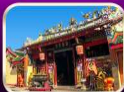
ศาลเจ้าแม่ลิ้มกอเหนี่ยว

ที่เที่ยวเพิ่มขึ้น และ ช่วยฟื้นฟูเศรษฐกิจภาคใหญ่