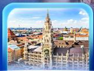
จัตุรัสมาเรียนพลาทซ์

เวียนนา ปราสาทนอยชวาสไตน์ ลูเซิร์น เซอร์แมท ชุก ซูริก