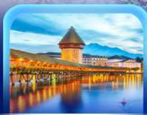
สะพานไมซ์าเปลา