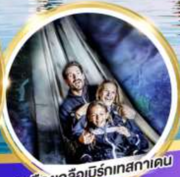
เหมืองเกลือบิรท์เทสกาเดิน