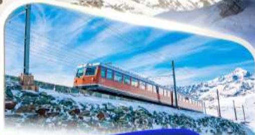
ขบวนรถไฟฟันเฟืองก่อนนอร์แอนด์