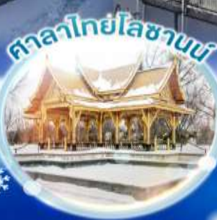
ศาลาไทยโลซานน์