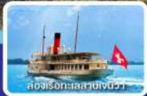
ล่องเรือทะเลสาบเจนีวา