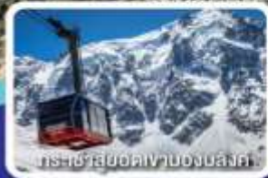
กระเช้าล่องเขาของบลังค์