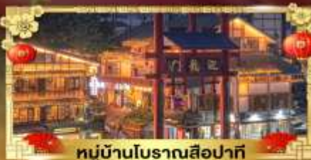
หมู่บ้านโบราณสี่ปาตี

เที่ยว 2 มณฑล "ฉงชิ่ง & เฉิงตู" อุทยานหลุมบ่อฟ้า ภูเขาสี่ดรุณี