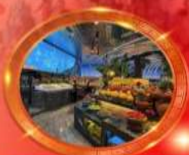
มือพิเศษ บุฟเฟต์นานาชาติ