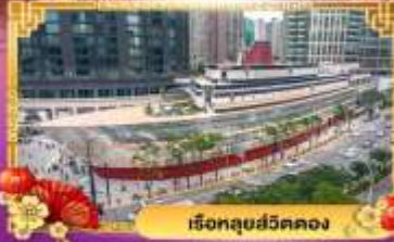
เรือทูลย์สวัสดิ์คลอง