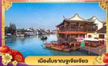
เมืองโบราณซูเจียเจียว