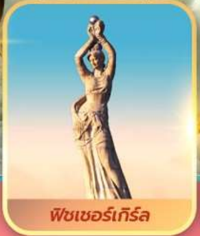
ฟิชเชอร์เกิร์ล