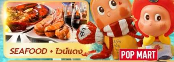
SEAFOOD + ไวน์แดง