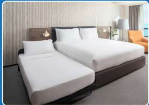
👤👤+👤 TRIPLE (TRP)

**รูปภาพห้องพักเป็นเพียงภาพสื่อถึงประเภทของเตียงเท่านั้น ไม่ใช่ภาพห้องพักจริงสำหรับการเข้าพัก**