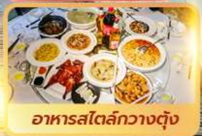
อาหารสไตล์กวางตุ้ง