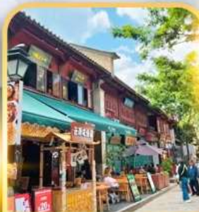
KUNMING OLD STREET