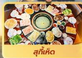
สุกี้เห็ด