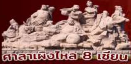
ศาลาเฟิงไห่ 8 เชียว