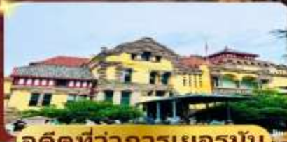
อดีตท่าการเยอร์มัน