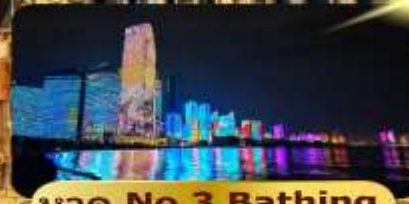
หาด No.3 Bathing

เมนูพิเศษ อาหารซีฟู้ด 6 วัน 4 คืน เดินทาง : ก.พ. – มี.ค. 69