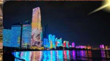
หาด No.3 Bathing

เมนูพิเศษ อาหารซีฟู้ด 6 วัน 4 คืน เดินทาง : พ.ค. – มิ.ย. 69