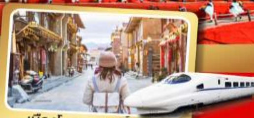
เมืองโบราณจงเตี้ยน