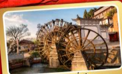
เมืองเก๋าลี่เจียง