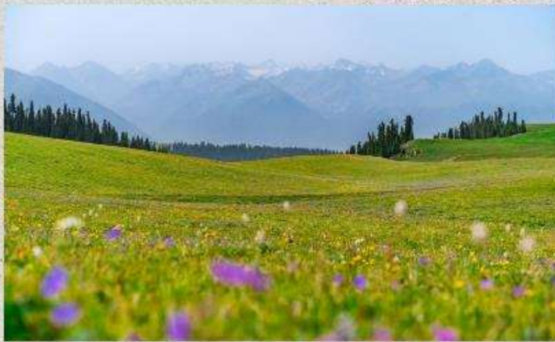
ทุ่งหญ้าคารา