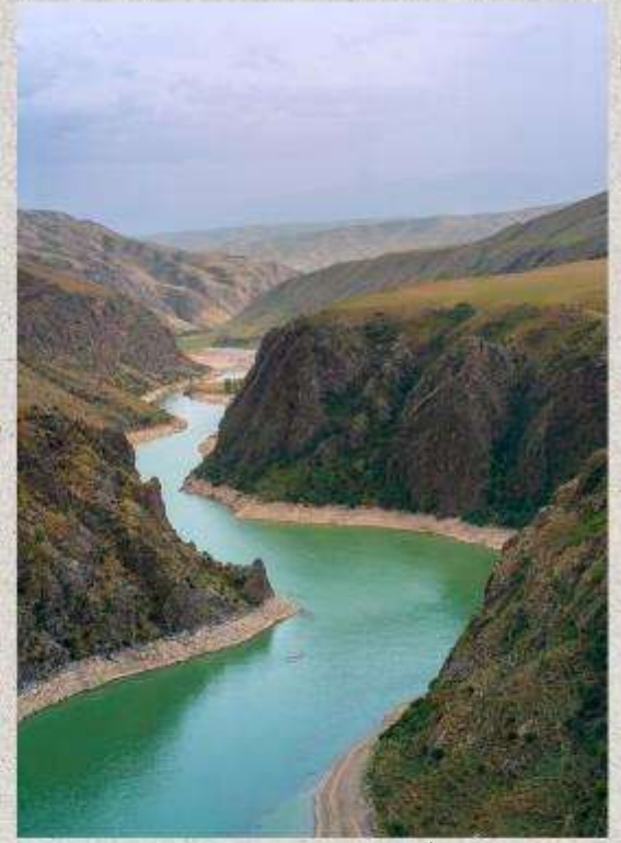
แกรนด์แคนยอนคุโคซู