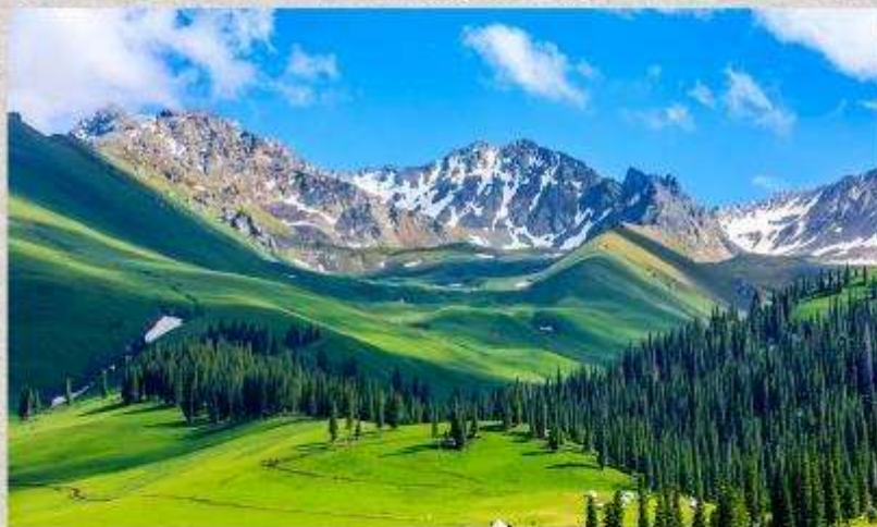
ทุ่งหญ้านาลากี