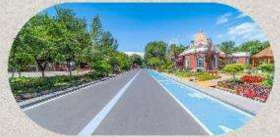
หมู่บ้านโบราณอุยกูร์คาจันจี