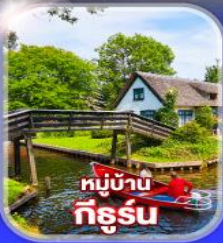
หมู่บ้าน กีร์รุน