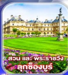
สวน และ พระราชวัง ลักซิมบวร์