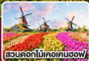
สวนดอกไม้เคอเคนฮอฟ

ดอกไม้ที่สดใส กับ หัวใจที่เปิดบาน ฝรั่งเศส เบลเยียม ลักเซมเบิร์ก เยอรมนี เนเธอร์แลนด์ 8 วัน 6 คืน