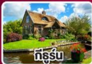
ทีร์รู่น