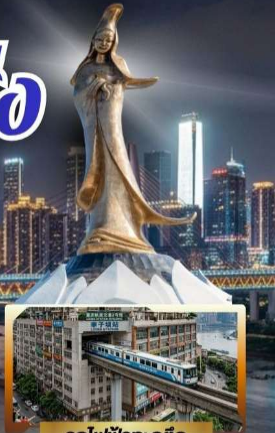
รถไฟฟ้ากะลุดัก