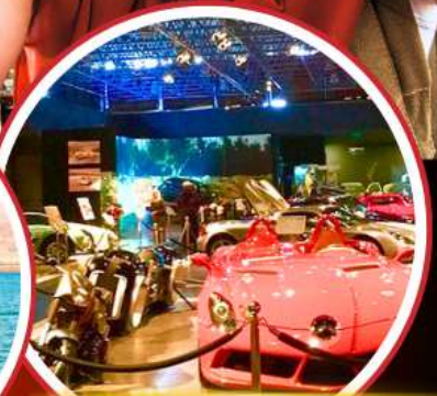
Royal Automobile Museum