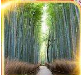
ป่าไฟอาราชิยาม่า

โอซาก้า นารา เกียวโต อิสระท่องเที่ยว 1 วันเต็ม!!