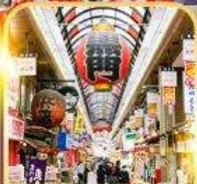
ตลาดคุโรมง