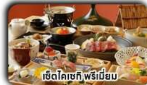
เซตโคเชกิ พรีเมียม