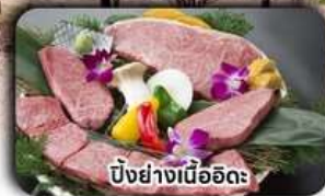
บิงย่างเนื้ออิดะ