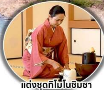
แต่งชุดกิโมโนชิมชา