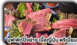
บุฟเฟ่ต์บิงย่าง เนื้อญี่ปุ่น พรีเมียม