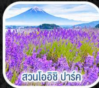
สวนโออิชิ ปาร์ค