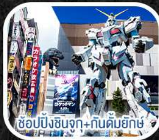
ช้อปปิ้งชินจูกุ+กันดั้มยักษ์