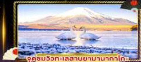
จุดชมวิวกะเผลสาบยามานากาโกะ