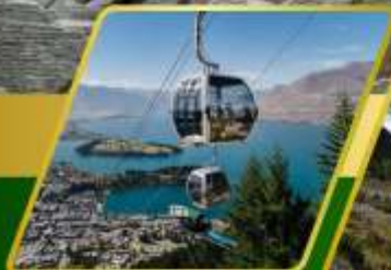
นั่งกระเช้า gondolá รับประทานอาหาร