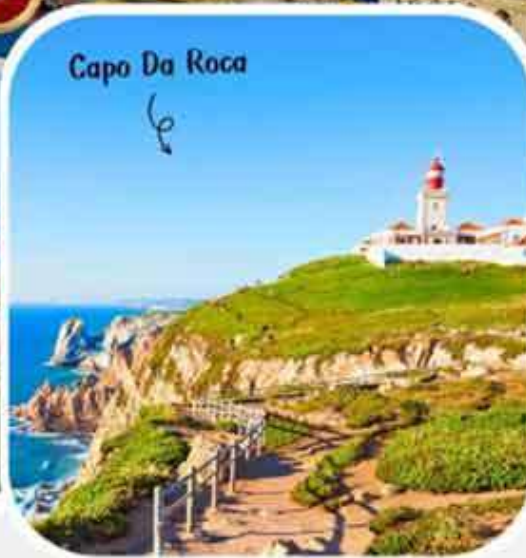
Capo Da Roca