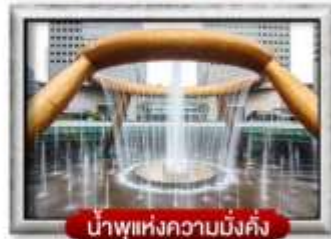
น้ำพุแห่งความมั่งคั่ง