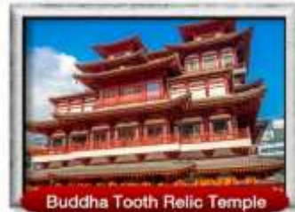
Buddha Tooth Relic Temple