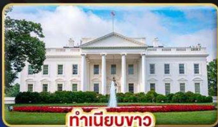
ทำเนียบขาว