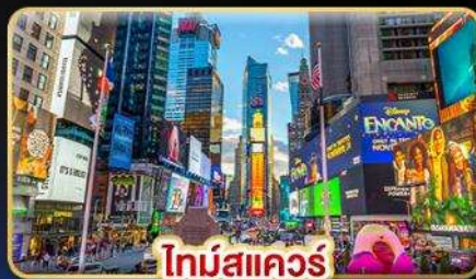
ไทม์สแควร์