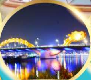
สะพานมังกรพ่นไฟ