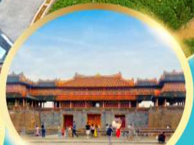
พระราชวังโบราณไคโนย