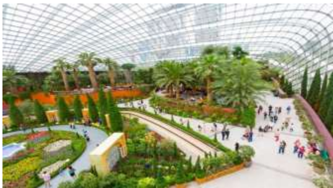
ต้นไม้ฟุ้งกระจายไปทั้งโดม

Flower Dome จะเป็นที่จัดแสดงพรรณไม้จากเขตร้อนชื้นแถบเมดิเตอร์เรเนียน มีต้นไม้ตัดยักรักษ์และปาล์มขวดมากมายให้เราได้ถ่ายรูป รวมถึงมีสวนจิ๋วน่ารักๆ ให้เราดูอีกด้วย เหมาะแก่การไปนั่งอ่านหนังสือ นั่งเล่นชิลๆ เพราะในเรือนกระจกจะติดแอร์ให้อากาศเย็นสบาย และมีกลิ่นหอมๆ ของดอกไม้และ