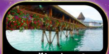
สะพานไม้ชาเปล ลูซิิร์น