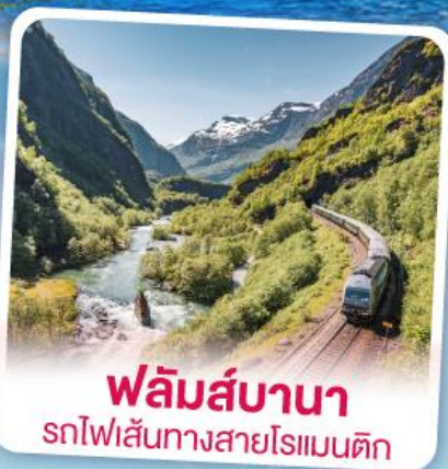
ฟลัมส์บานา รถไฟเส้นทางสายโรเมนติก