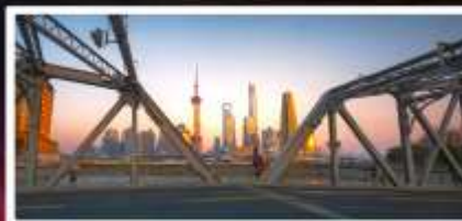
สะพานไวโปกตุ