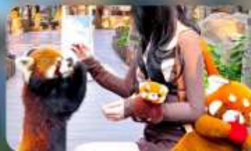
ให้อาหารแพนด้าแดง