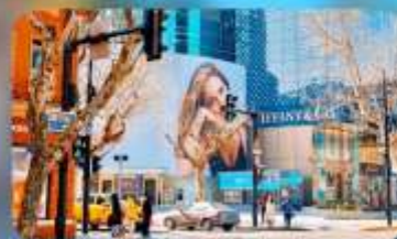
ถนนทวยไห้มิดเคิ้ลโรัด