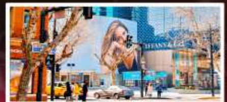
ถนนหยอไห่มีดเคิลโรด