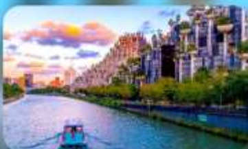
อาคารพินตันไม้