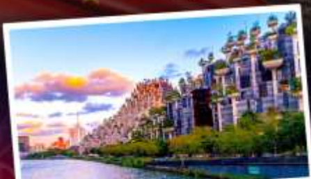
อาคารพันต้นไม้

ชมการแสดงพลุสุดปังที่สวนสนุกดิสนีย์แลนด์