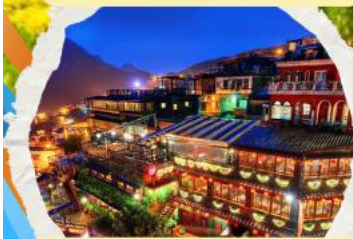
หมู่บ้านโบราณฉิวเฟิง