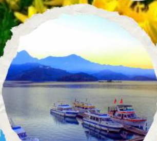
ทะเลสาบสุริยขึ้นฉิงทารา