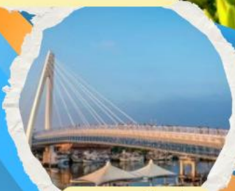
สะพานต้งสู่ย