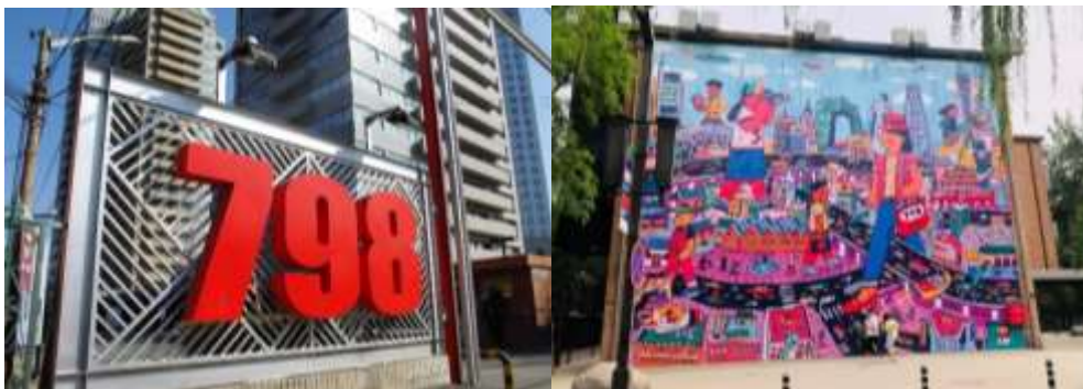
JL-BJ014 จีน ปักกิ่ง BFSU 798 ART PARK ถนนเฉียนเหมิน POP MART 14วัน 3คืน

798 Art Park คือแลนด์มาร์คศิลปะแห่งใหม่ในกรุงปักกิ่ง และเป็นแหล่งรวมตัวของคนหนุ่มสาวผู้รักศิลปะและวัฒนธรรม พื้นที่นี้รู้จักกันในชื่อ 798 แต่แท้จริงแล้วเป็น สวนนวัตกรรมที่ปรับปรุงใหม่จากโรงงานอุตสาหกรรมอิเล็กทรอนิกส์เก่าของรัฐ ที่เรียกว่า 718 Joint Factory และ Factory 798 ก็เป็นหนึ่งในนั้น ตั้งแต่ปี พ.ศ. 2544 ศิลปินจากทั่วกรุงปักกิ่งและนอกกรุงปักกิ่งได้มารวมตัวกันที่ Factory 798 วิสัยทัศน์ทางศิลปะอันเป็นเอกลักษณ์ของพวกเขาได้ค้นพบข้อได้เปรียบของสถานที่แห่งนี้สำหรับงานศิลปะ พวกเขาเช่าและใช้ประโยชน์จาก อาคารโรงงานดั้งเดิมสไตล์เบาสบายของเยอรมนี อย่างเต็มที่ ด้วยเฟอร์นิเจอร์และการตกแต่งเพียงเล็กน้อย พวกเขาประสบความสำเร็จในการเปลี่ยนโรงงานที่เลิกใช้งานแล้วเหล่านี้ให้กลายเป็นพื้นที่พิเศษสำหรับการจัดนิทรรศการและการสร้างสรรคงานศิลปะ ปัจจุบัน 798 Art Park เป็นที่ตั้งของแกลเลอรี นิทรรศการ ศูนย์ศิลปะ และศิลปินอิสระเกือบ 200 แห่ง มีสถาปัตยกรรมที่ออกแบบอย่างสร้างสรรค์ ร้านบูติกเก๋ๆ คาเฟ่ และร้านอาหารมากมาย (เที่ยวตามอัธยาศัยตลอดวัน พี่เลี้ยงพาไป)