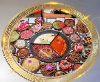
บุฟเฟ่ต์มือโหลงซิ่ง