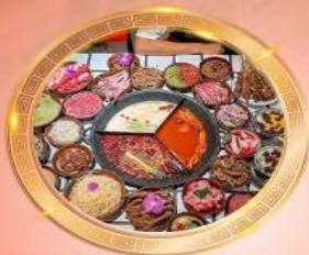
บุฟเฟต์หม้อไฟลงชิง