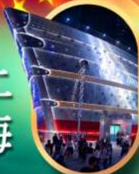
เรือคองหลุยส์