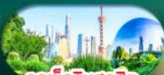
จุดเช็กอินสุดฮิต North Bund Shanghai