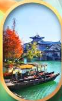
เมืองโบราณผู่หยวน