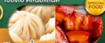
พิเศษ เสี่ยวหลงเป่า หมูแดงพอ เดินทาง ม.ค. - มิ.ย. 69