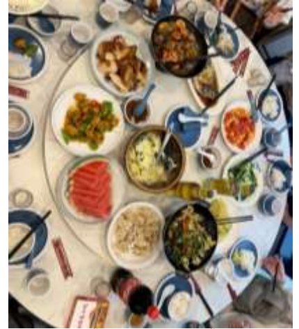
*ภาพนี้ใช้เพื่อการโฆษณาเท่านั้น*