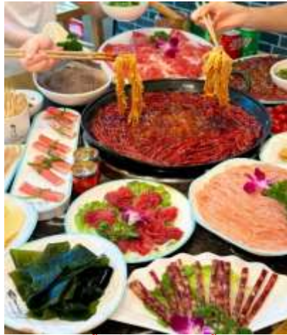
*ภาพนี้ใช้เพื่อการโฆษณาเท่านั้น*