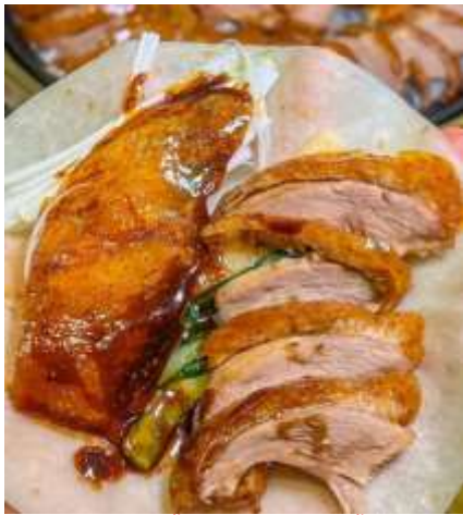
*ภาพนี้ใช้เพื่อการโฆษณาเท่านั้น*