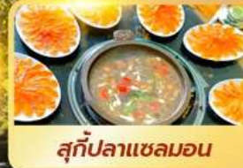
สุกัปลาแซลมอน