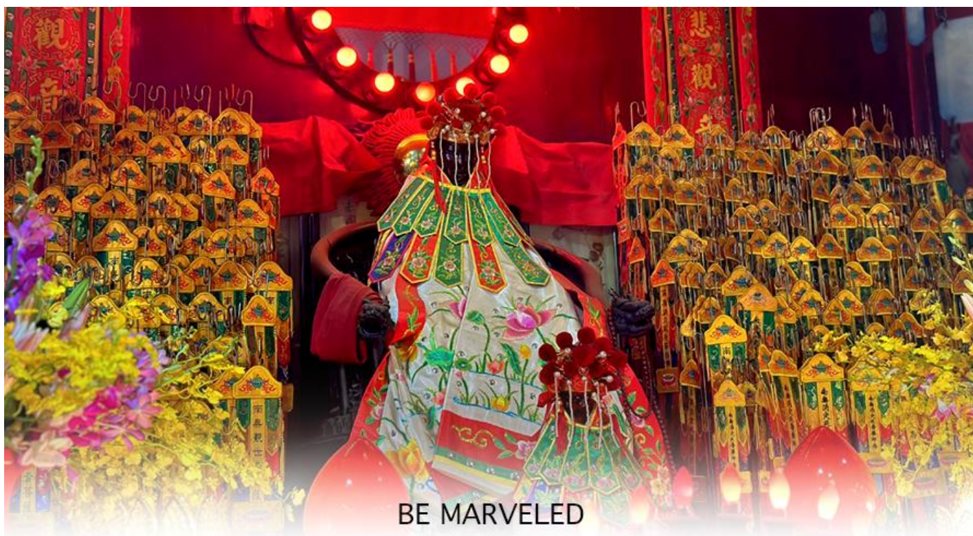
BE MARVELED วัดเจ้าแม่กวนอิมฮองอ้า (ยิมฮิน)

มาเก่า จะมี "วันเปิดทรัพย์" หรือ "พิธีเยี่ยมเงิน เจ้าแม่กวนอิมฮ่องกง" เป็นวันที่จะมาขอพรและเยี่ยมเงินเจ้าแม่กวนอิม ซึ่งนับจาก หลังวันตรุษจีน ไป 26 วัน จะเป็นวันเปิดทรัพย์ที่จัดขึ้นในทุกๆปี พิธีนี้จะมีเพียงครั้งปีละครั้งเท่านั้น เป็นวันสำคัญอีกวันที่คน หลังไหลมาไหว้ขอพรอย่างไม่ขาดสาย