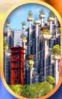
อาคาร 1,000 คัดไม้