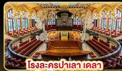
โรงละครปาเลา เดลา มุสิก้า คาคาลานา