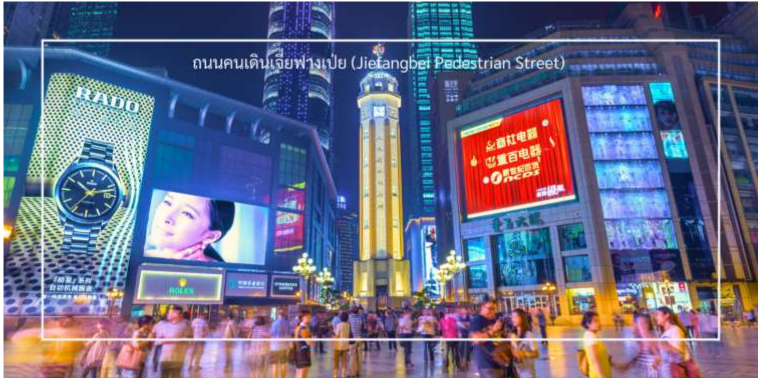
ถนนคนเดินเจียงเป่ย์ (Jiefangbei Pedestrian Street)

และการแสดงต่างๆ ที่ทำให้บรรยากาศน่าสนใจยิ่งขึ้น และยังเต็มไปด้วยร้านค้าแบรนด์เนม ร้านค้าท้องถิ่น และตลาดที่ขายสินค้าต่างๆ เช่น เสื้อผ้า เครื่องประดับ และของที่ระลึก แวะชมร้าน POP MART ร้านดังจากจีน ที่รวมฟิกเกอร์ดีไซน์เก๋และตุ๊กตาน่ารักหลากหลายซีรีส์ยอดนิยม เช่น Molly, Dimoo, Labubu และอีกมากมาย ที่สายสะสมของเล่นไม่ควรพลาด