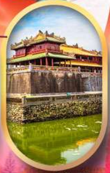
พระราชวังไคไญ