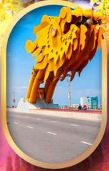
สะพานมังกรคานิง