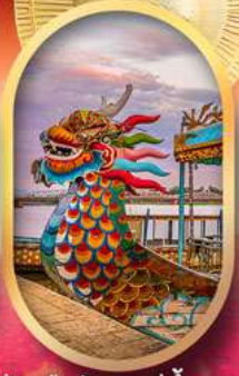
ล่องเรือมังกรแม่น้ำหอม