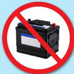
แบตเตอรี่ดำ