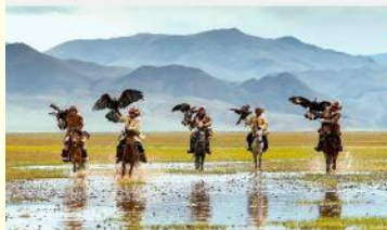
ชนเผ่ามองโกเลีย