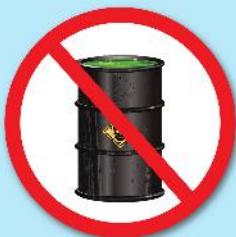
สารกัมมันตรังสี