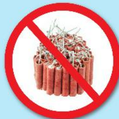
พลุ, ประทัด