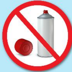
กระป๋องสเปรย์