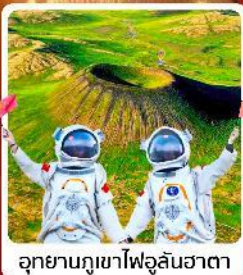
อุทยานภูเขาไฟอูลันฮาตา