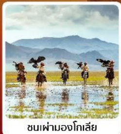
ชนเผ่ามองโกเลีย