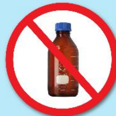
ขวดสารเคมี