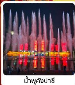
น้ำพุคังปาสี

● โอโหล้ เป็นทรายสีเหลืองขาวน แหล่งท่องเที่ยวระดับ 5A ของจีน ภูเขาไฟอูลันฮาตา น้ำพุคังปาสี น้ำพุที่สูงที่สุดในเอเชีย