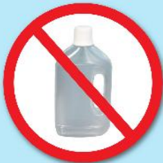
ขวดน้ำยา