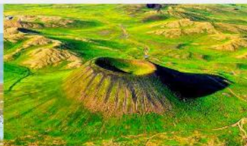
อุทยานภูเขาไฟอูลันฮาตา