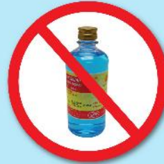
ขวดแอลกอฮอล์