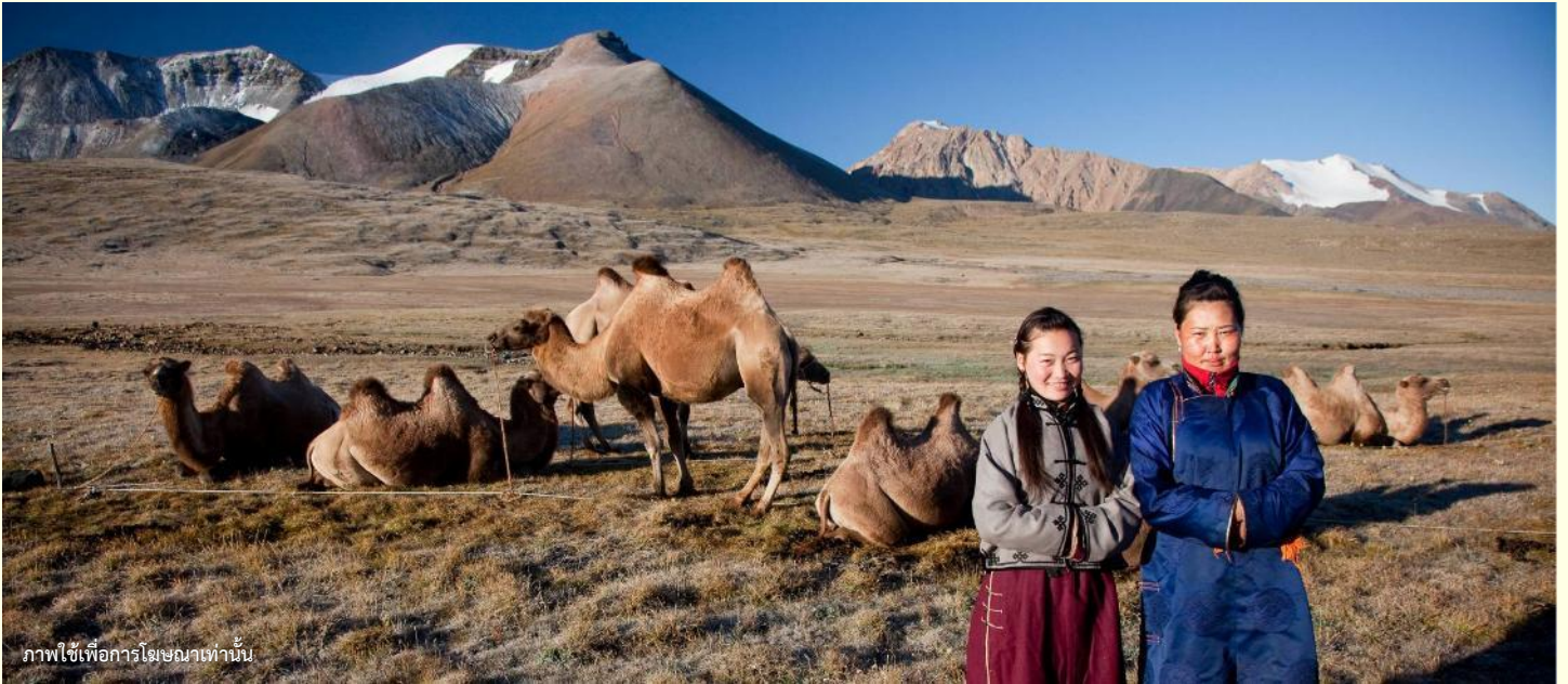
ภาพใช้เพื่อการโฆษณาเท่านั้น

นำท่านร่วมกิจกรรม พิธีต้อนรับแขกสไตล์มองโกล เป็นประเพณีโบราณที่มีมาช้านาน ชาวมองโกลมีอุปนิสัยที่รักเพื่อนฝูงและตรงไปตรงมาไม่เสแสร้ง เมื่อมีเพื่อนหรือแขกมาเยือนก็มักจะผูกมิตรอย่างจริงจัง และนำท่านร่วมกิจกรรม สวมใส่ชุดมองโกล สัมผัสพลังแห่งบรรพบุรุษ สวมเสื้อคลุมแบบดั้งเดิมที่มีสีสันสดใส ปักลวดลายอันประณีต คุณจะสัมผัสได้ถึงพลังแห่งบรรพบุรุษที่เคยปกครองดินแดนครึ่งโลก การสวมหมวกขนสัตว์ ผูกสายรัดเอว พร้อมเครื่องประดับเงินแท้ที่ส่องแสงระยิบระยับ จะทำให้ท่านเสมือนกลายเป็นนักรบแห่งทุ่งหญ้า พร้อมเครื่องประดับเงินแท้ที่ส่องแสงระยิบระยับ ของชนเผ่าที่เคยปกครองดินแดนครึ่งโลก เมื่อคุณยืนท่ามกลางทุ่งหญ้าไร้ขอบเขต