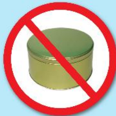
กล่องโลหะ