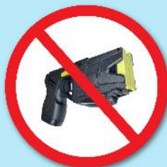
ปืนซ็อตไฟฟ้า