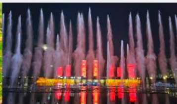
น้ำพุคังปาซี