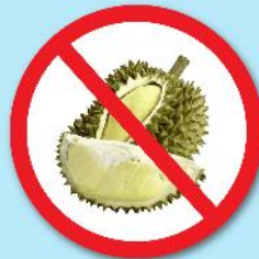
ผลไม้เขตร้อน ที่มีหนาม