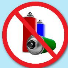
ขวดสเปรย์