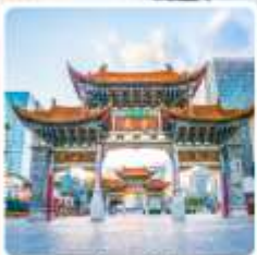
ประตูน้ำทองโก๋หยก