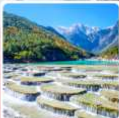
ทะเลสาบโป๋สุ่ยเหอ