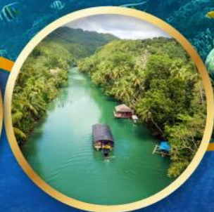
ล่องเรือแม่น้ำโลบ็อก