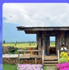
ร้านกาแฟหยุนตัน